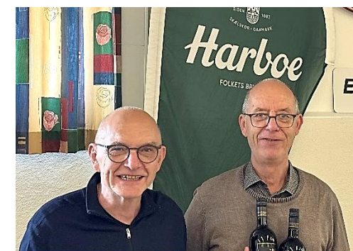
2 gange Hansen vandt Hvid række